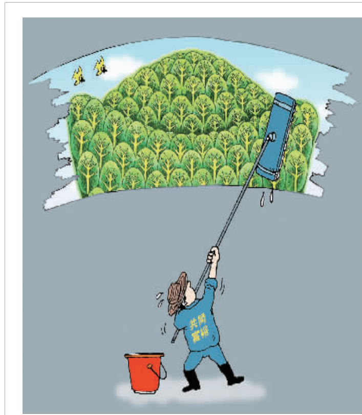
共同富裕色 高晓建 作

时时放心不下,事事尽职尽责。克服麻痹松懈心理,保持警醒敬业状态,就一定能够应对风险挑战,干出过硬业绩。