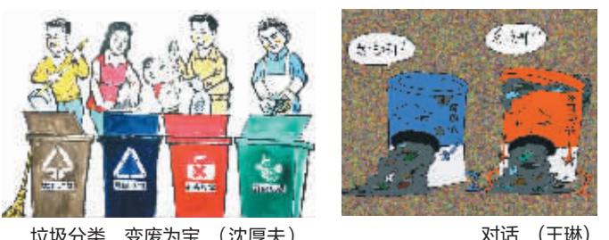
垃圾分类 变废为宝 (沈厚夫)