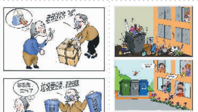
打开窗户说亮话 (徐壮)