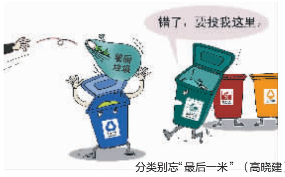
分类别忘“最后一米” (高晓建)