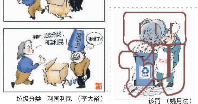
垃圾分类 利国利民 (李大裕)