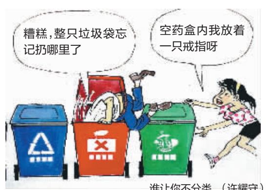
谁让你不分类 (许耀守)