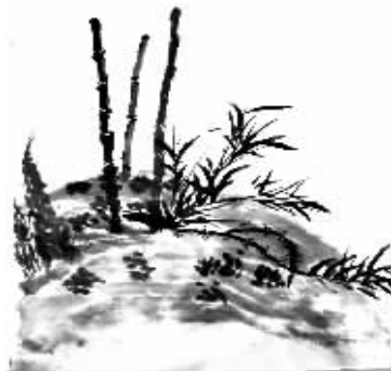
诸暨市江藻小学 503班 李烨诺 指导老师 斯伟丽