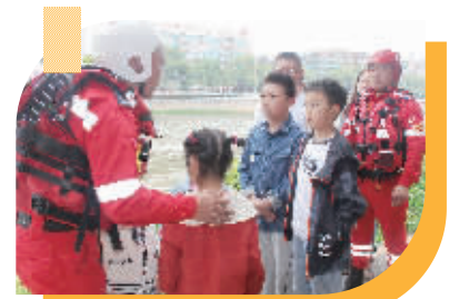
近日,诸暨市行知小学家委会成员邀请该市民安救援队成员,在城市近水水域对孩子们进行防溺水教育。学校对此次活动进行专程拍摄,以此为契机对全体学生进行防溺水教育。(通讯员 俞飞)