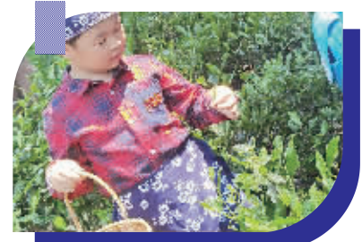
5月3日,鲁迅幼托中心御景园区大(4)班新蕊小分队的小朋友们来到越城区富盛镇,徒步登上五峰岭,开展采茶制茶、制作竹筒饭等学农活动。这次活动,让孩子们体验了劳动的乐趣,也感悟到了劳动的真正意义。(通讯员 赵叶青 沈夏娟)