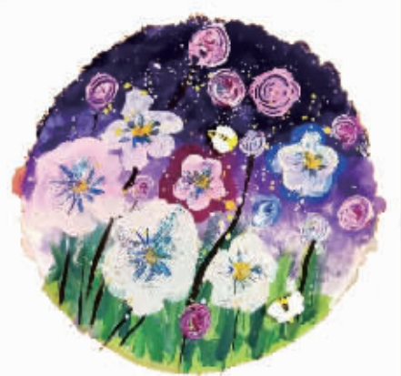
诸暨市姚江镇直埠小学 101班 傅钰馨 指导老师 俞蕾