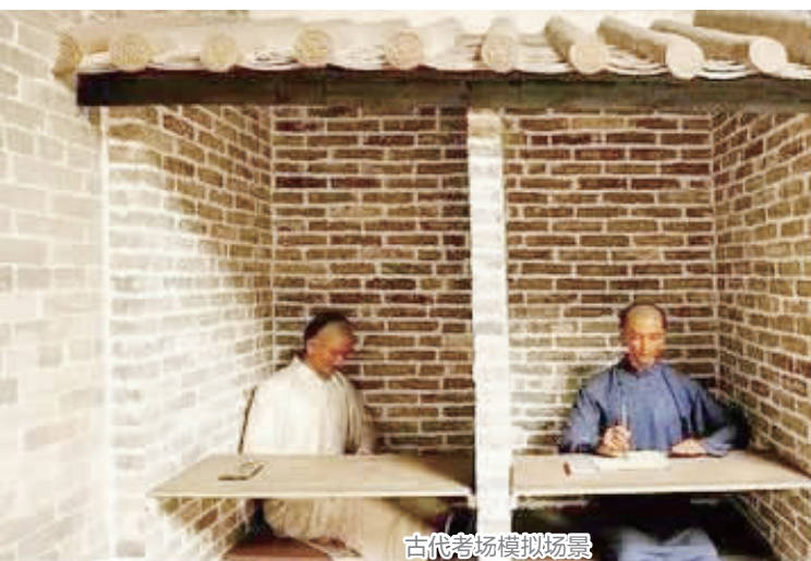
古代考场模拟场景

那么,古代的考场是什么样的呢?九天六夜,学子们在怎样的环境中度过?中国古代读书人向来有十年寒窗之说。其实,不仅是备考之路道阻且长,就是一举成名前的科场考试,考场生活之艰难,也让无数读书人苦不堪言,乃至被形容为“三场辛苦磨成鬼,两字功名误煞人”。不过,贡院生活虽然辛苦,但这里仍是古代读书人梦寐以求的地方。