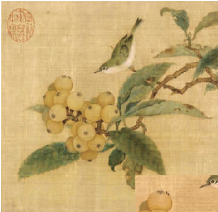
南宋画家林椿的《枇杷山鸟图》

日子摇曳多姿,生活越来越好。每当看到明亮的灯光,总忘不了曾经用过的那盏煤油灯。或许是因为刻骨铭心,所以不论岁月怎样流过,那闪烁点点亮光的煤油灯总是在脑海里挥之不去。