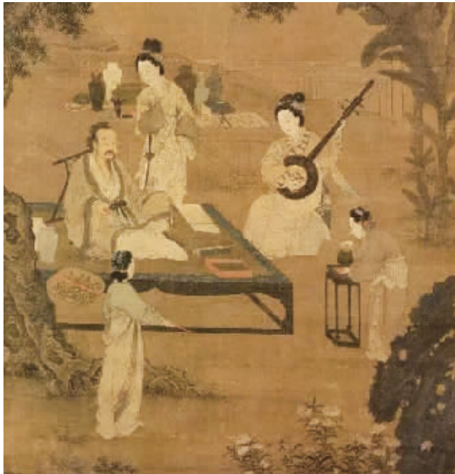
宋代画家李嵩的《听阮图轴》